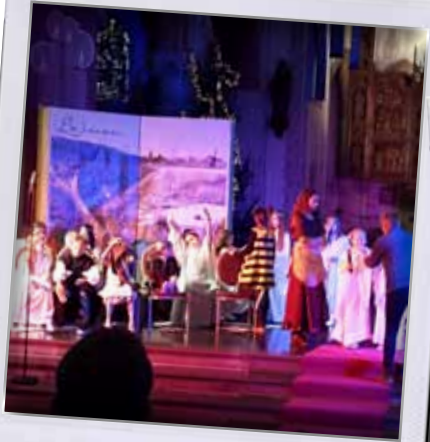
Musical "De kleine honing bij"