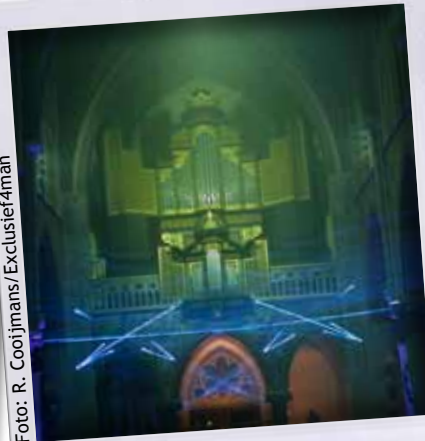
Old meets new Laser show