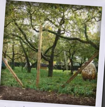
Voorbode van Pasen? Koostertuin St. Agatha