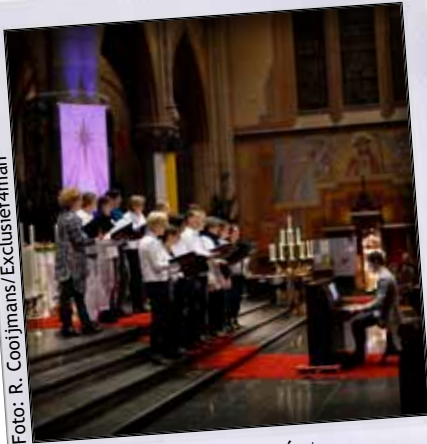
Creation tijdens Old meets new