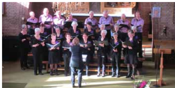
Concert oktober 2014

Het koor ging zich richten op de kerkelijke zang en verzorgde vanaf die tijd ook de kerkelijke diensten; het repertoire ging bestaan uit kerkzang in het Nederlands en Latijn, terwijl ook de profane zang niet achterwege werd gelaten. Ook dit jaar kan de parochie weer rekenen ondersteuning van de diensten door Vivace.